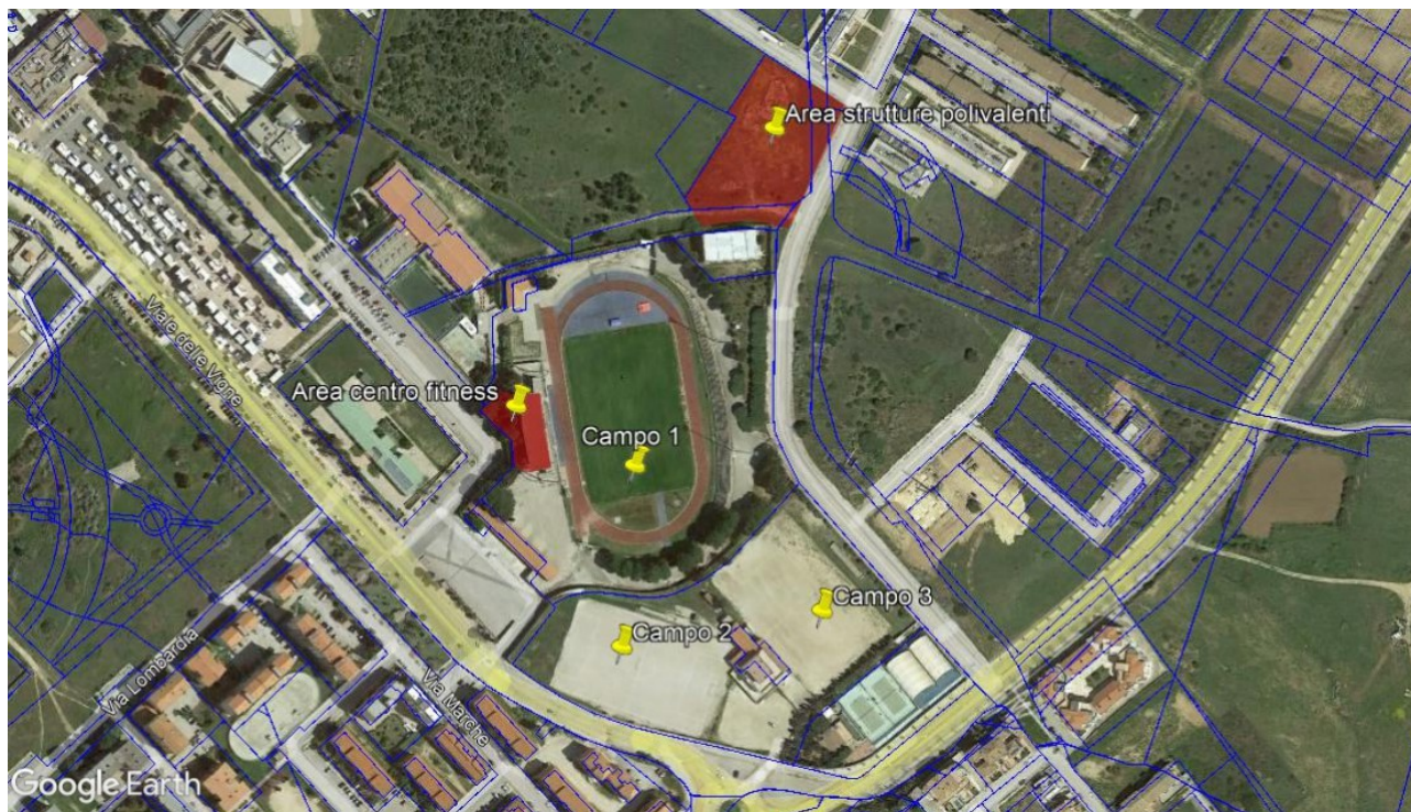
Vista aerea dell'area oggetto di intervento

Area lavori pubblici, manutenzioni, verde pubblico, sistemi informativi e finanziamenti comunitari