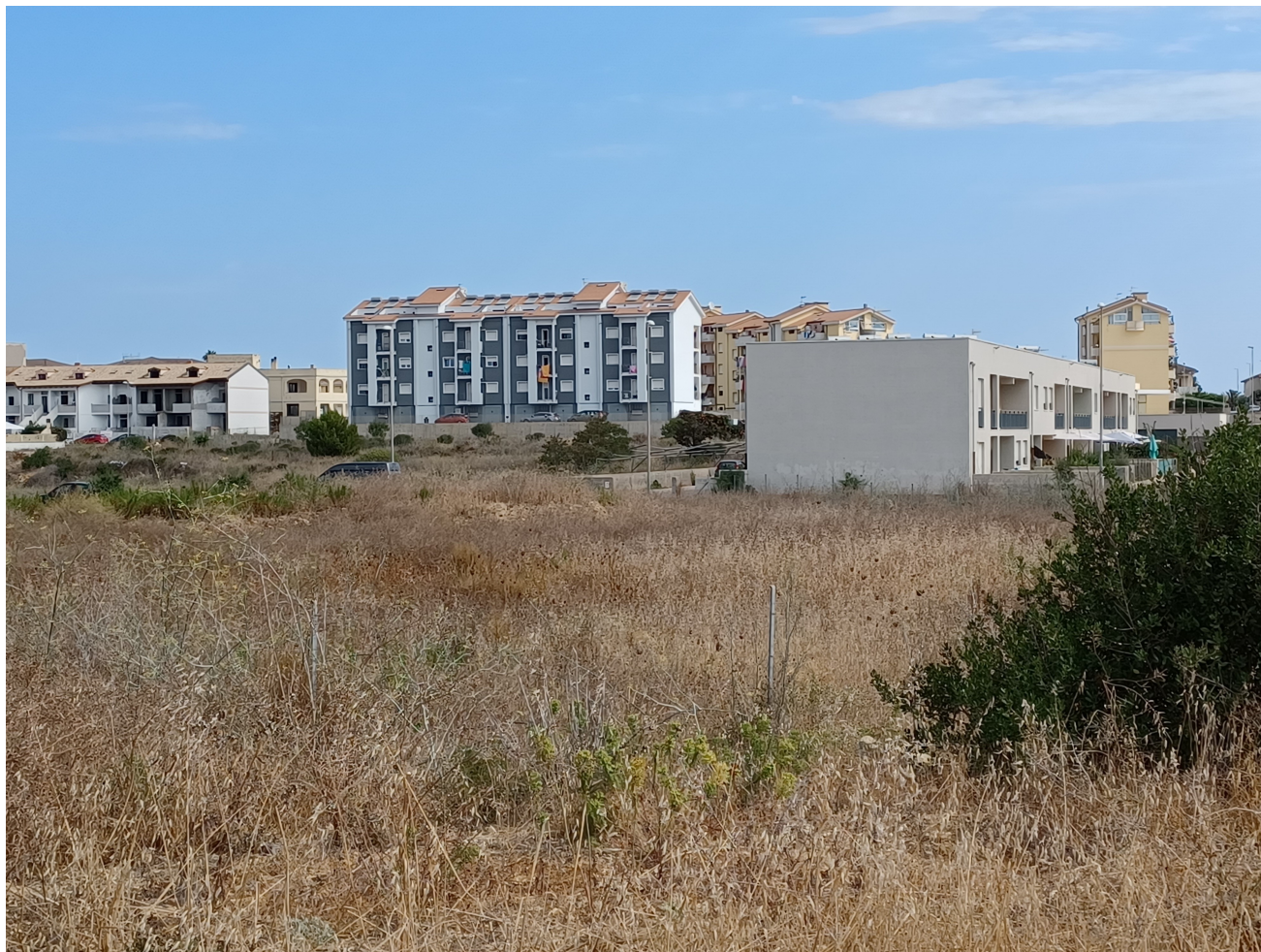
Area di intervento – vista da sud direzione nord

Area lavori pubblici, manutenzioni, verde pubblico, sistemi informativi e finanziamenti comunitari