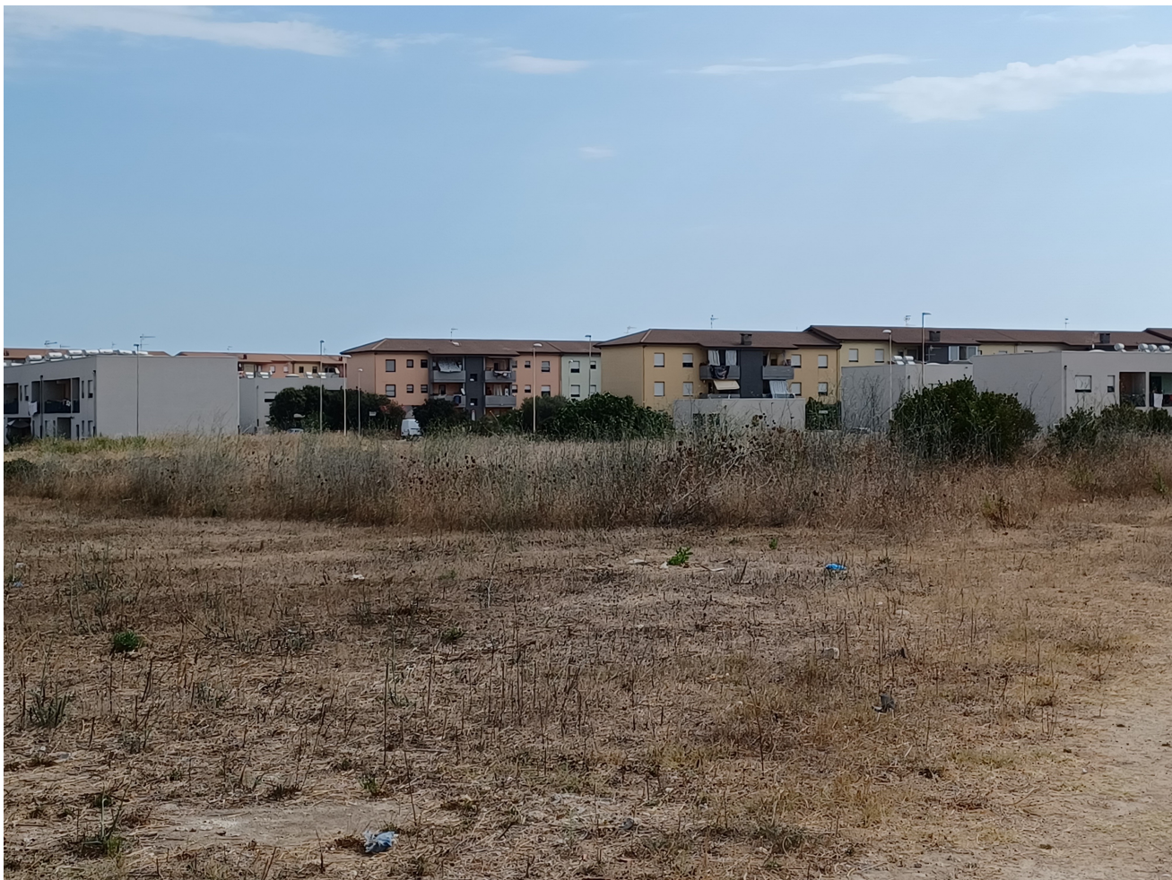
Area di intervento – Vista da sudovest direzione nordest

Area lavori pubblici, manutenzioni, verde pubblico, sistemi informativi e finanziamenti comunitari